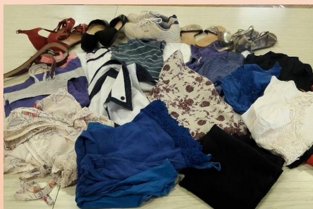
Comunidade da Escola Orminda Guimarães Cotrim colaborando com a campanha