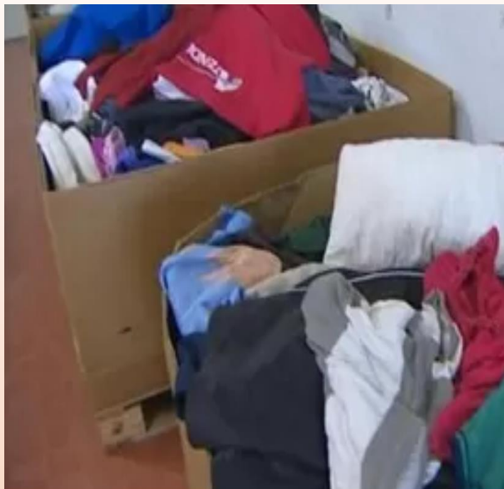
Caixas com alumas doações - Escola Basílio R. da Silva com paceria do Grêmio Estudantil “Voz Ativa”

A campanha, por meio do slogan "É tempo de doar!" convida todos para participarem com doação de peças de roupa em bom estado.