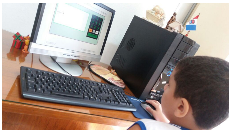
Aluno da escola Augusto Pereira de Moraes votando.

Dentre os principais objetivos dos Grêmios Estudantis estão a programação e a construção de regras e normas dentro das unidades escolares, além do aumento da participação dos alunos nas atividades na escola, organizando campeonatos, palestras, projetos e discussões, fazendo com que eles tenham voz ativa e participação, envolvendo pais, funcionários, professores, coordenadores e diretores – da programação e da construção das regras e normas, dentro das unidades escolares.