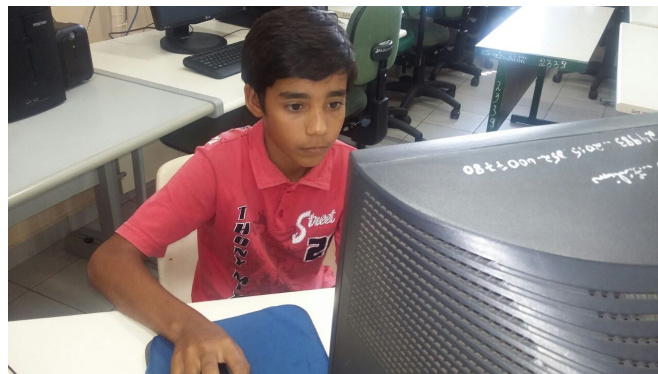
Aluno da EE José Florentino de Souza, da cidade de Braúna, votando.