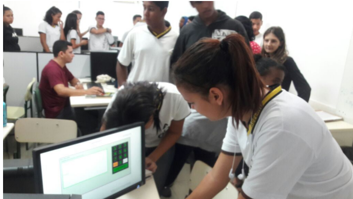
Alunos da EE Adelino Peters votando.