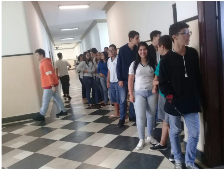
Alunos da EE Dr. Carlos Sampaio Filho aguardando para votar.