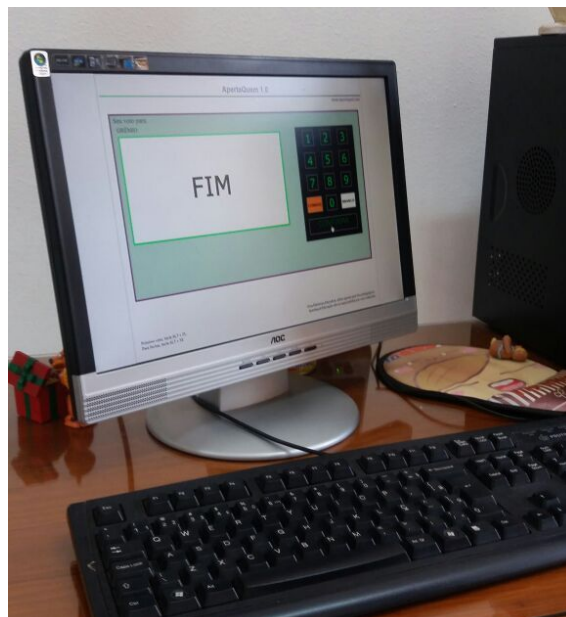
Imagem para chamada da notícia no site.