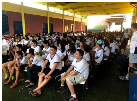
Apresentação dos projetos dos alunos dos 7º anos para toda a escola.