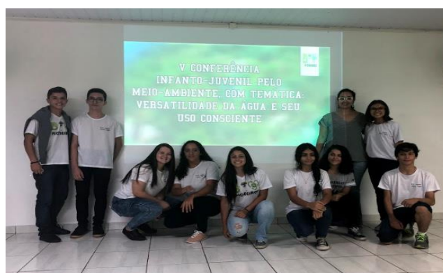
Apresentação dos trabalhos e oficinas dos alunos do 9º ano.