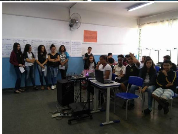
Alunos da EE Rosa Maria no momento da conferência.