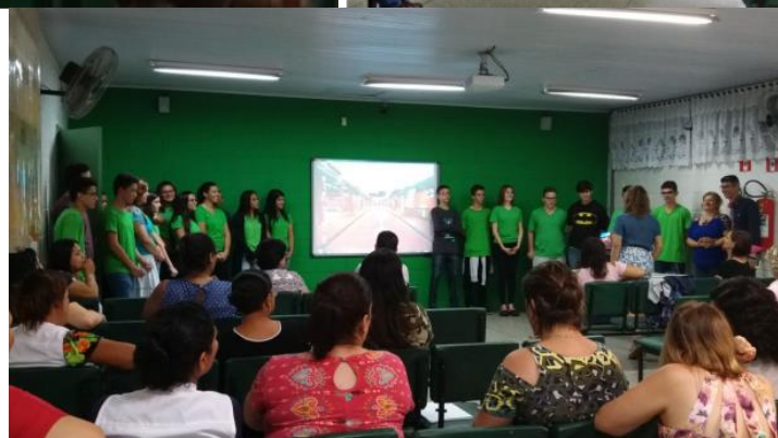
Apresentação dos trabalhos dos alunos para os professores.