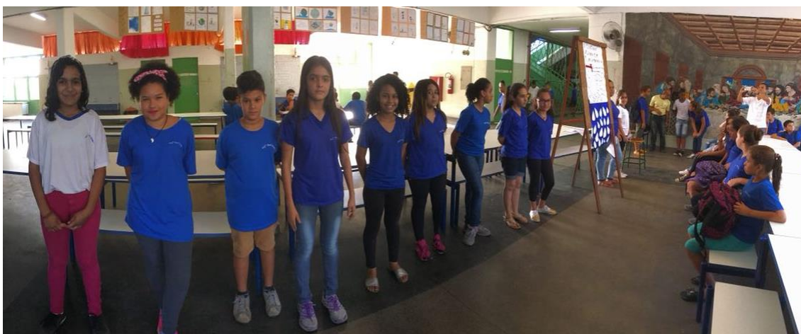
Apresentação dos trabalhos dos alunos do 7º ano para toda a escola.