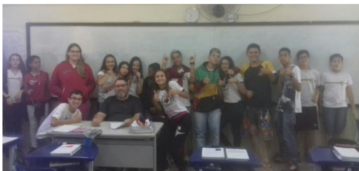
Alunos da escola municipal Prof a . Marina em Cerquilha, SP.