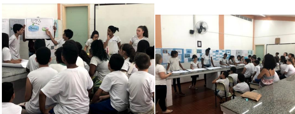
Apresentação de trabalhos dos 7º anos do Ensino Fundamental para os alunos dos 6º anos.