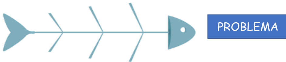
Família de causas