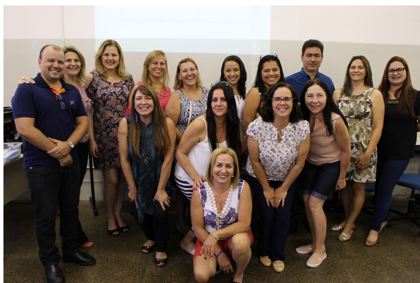
Professores Coordenadores da escolas jurisdicionadas a Diretoria de Ensino - Região de Penápolis