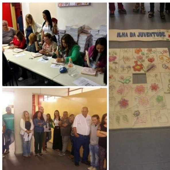
Ilha da Juventude Planejamento 2018