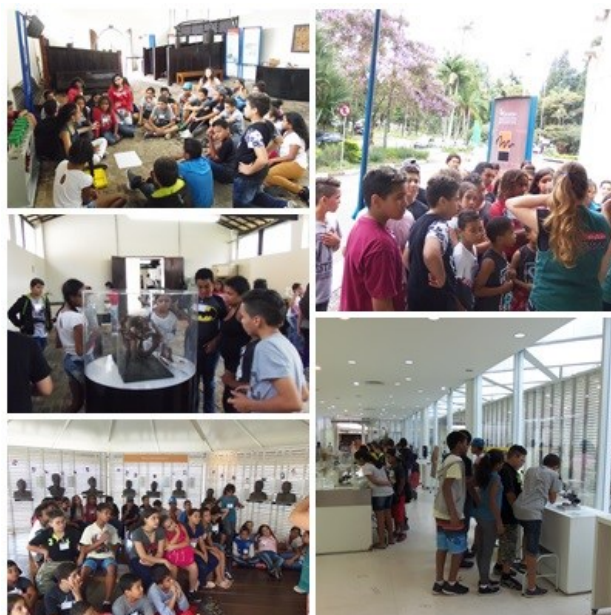
E.E. Prof. Cynira Stocco Fausto