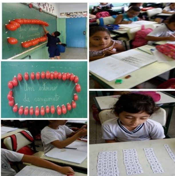
E.E. Friedrich Von Voith