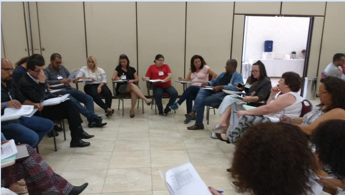
Estudos e discussões - Grupos