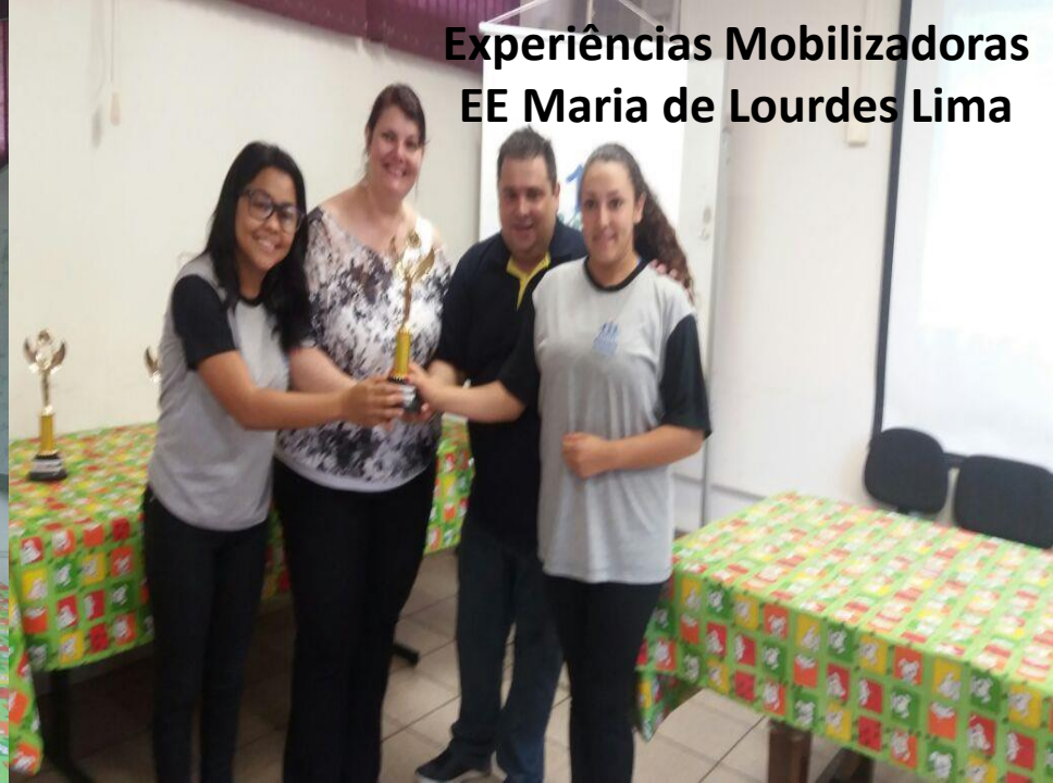
Experiências Mobilizadoras EE Maria de Lourdes Lima