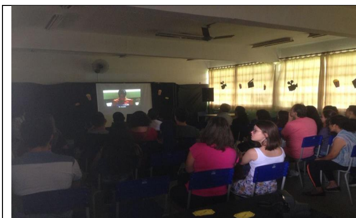
Projeto “O MUNDO EM CURTO E EM CURTAS”