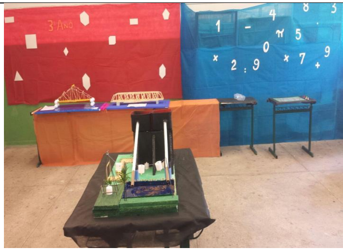
“MATEMÁTICA NA PRÁTICA” – Ensino Médio