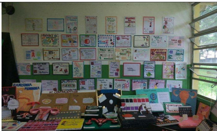
"A CIÊNCIA E O COTIDIANO"