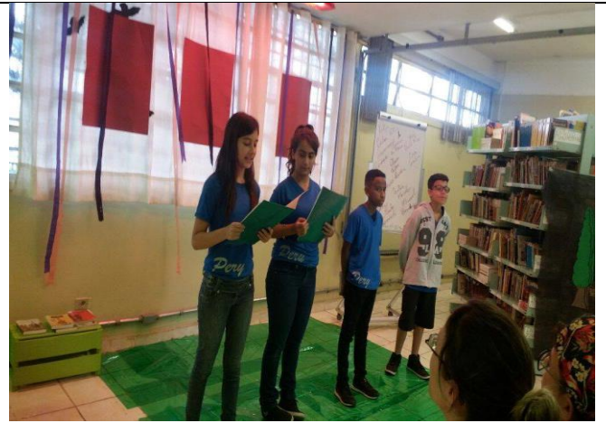
Sala de Leitura "RODA DE LEITURA POEMAS"