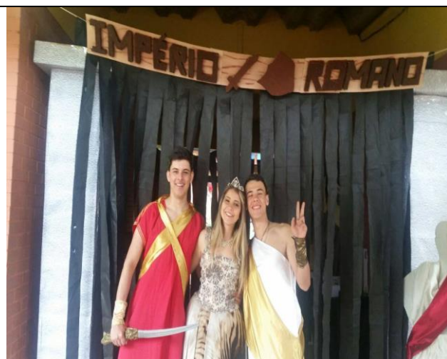
“JOGANDO COM O IMPÉRIO ROMANO”