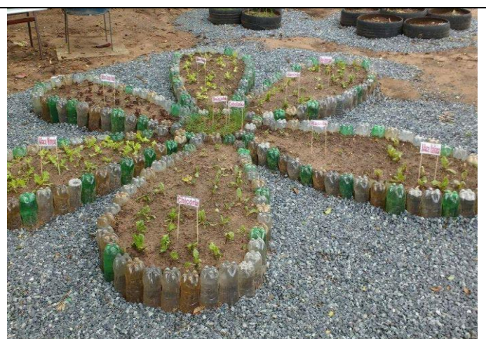
“SUSTENTABILIDADE – PLANTANDO E REUTILIZANDO”