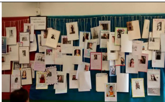
“O INGLÊS NO DIA A DIA – LEISURE AND LEARNING!”