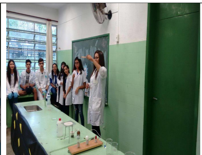
“SHOW DE QUÍMICA”