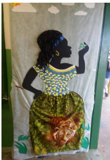
“AS CORES DO BRASIL”

Mais uma vez, a exposição demonstrou ser um sucesso; os visitantes saíram impressionados com a qualidade dos trabalhos produzidos pelos alunos. Toda a comunidade escolar (alunos, docentes, funcionários, gestores e familiares) ficou muito satisfeita com a exposição.