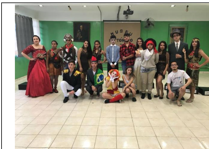
“MUSEU HISTÓRICO E LITERÁRIO”