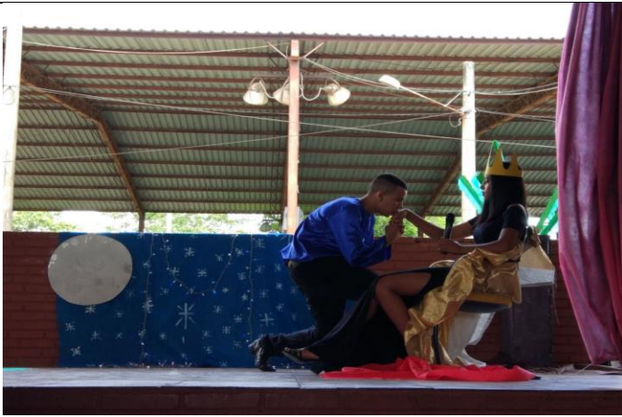
Projeto "LITERATURA ENCENA"