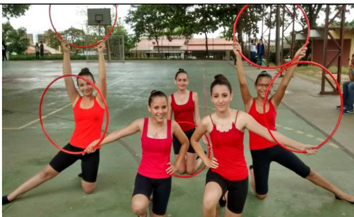
“Quadra – GINÁSTICA RÍTMICA”