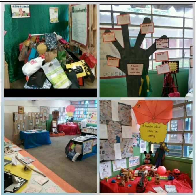
“O TRABALHO ESCRAVO ONTEM E HOJE”