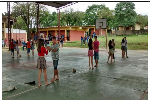
Quadra "DANÇA AOS PARES"