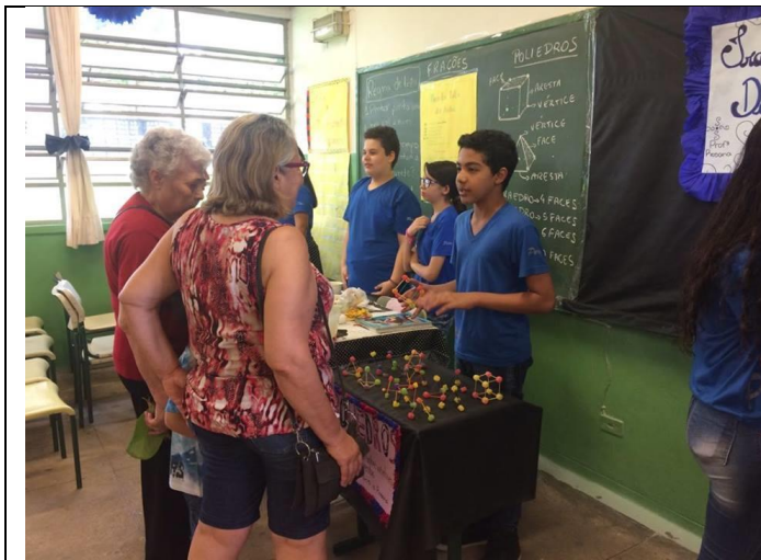
“MATEMÁTICA NA PRÁTICA” – Ensino Fundamental