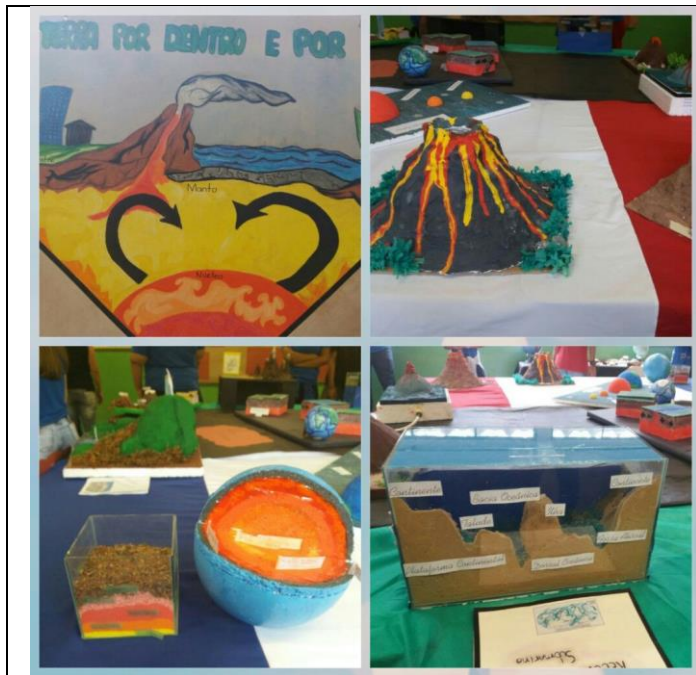
“A TERRA POR DENTRO E POR FORA”