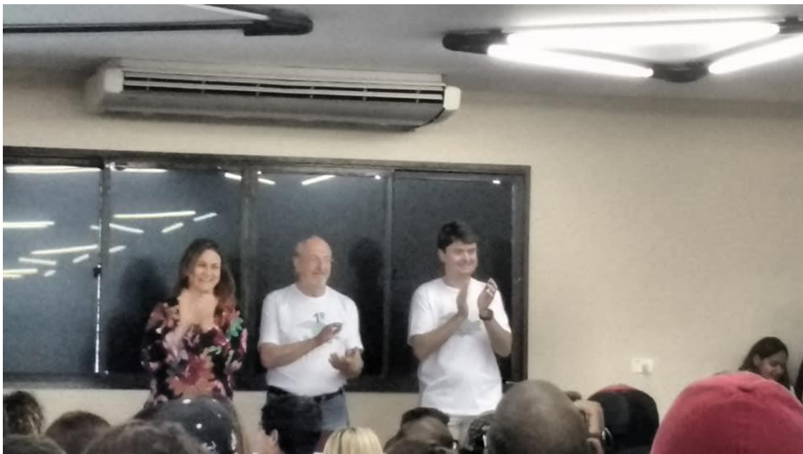
Secretário de Educação de SP – Dr. José Renato Nalini