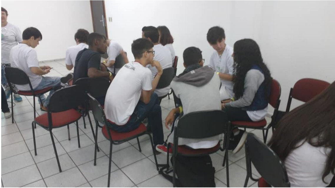
Trabalhos em grupos