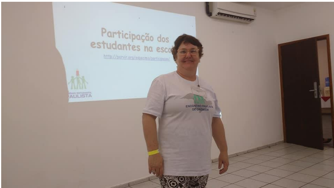
Formação aos Gremistas – participação da DIRETORIA DE ENSINO DE ITU/SP