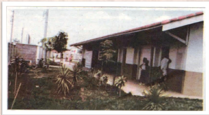
Vista da parte frontal do Prédio Escolar, inaugurado em 1986.

Em 31/01/1981 é publicado no D.O.E. seu Ato de Criação, pelo Decreto Nº 16.581 de 30/01/81, com a denominação EEPG “Prof. José Fernandes”. Em 19/06/1986 se deu a inauguração do novo prédio na Avenida 3, nº 735.