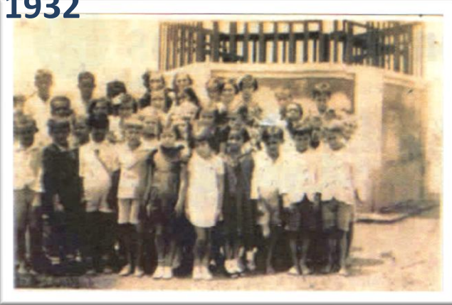
Escola Mista de Morro Grande (funcionando na casa da Capela, atual Igreja de St. Antônio).