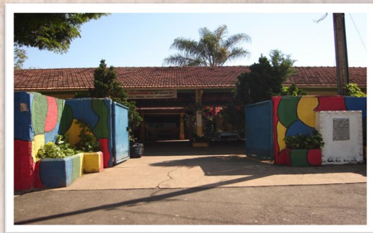
Fachada da Escola em 2006.