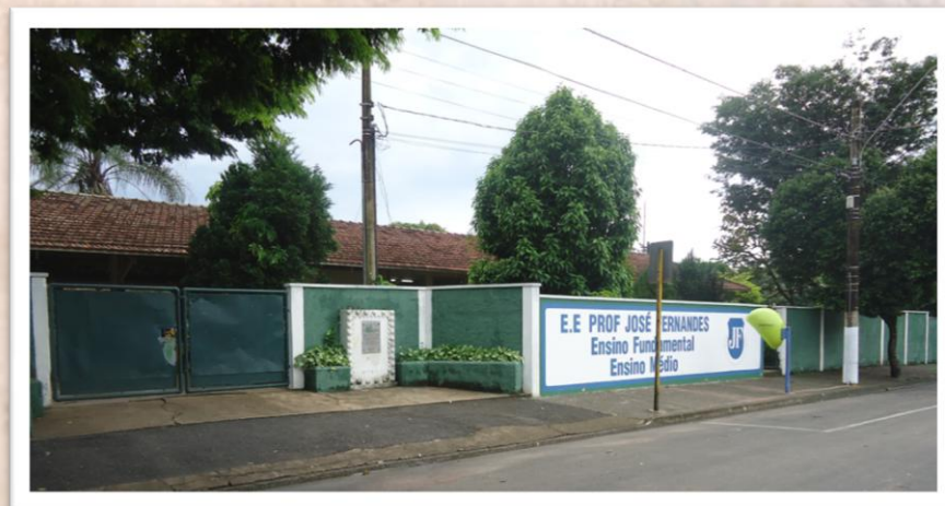
Fachada da E.E. Prof. José Fernandes (2017)