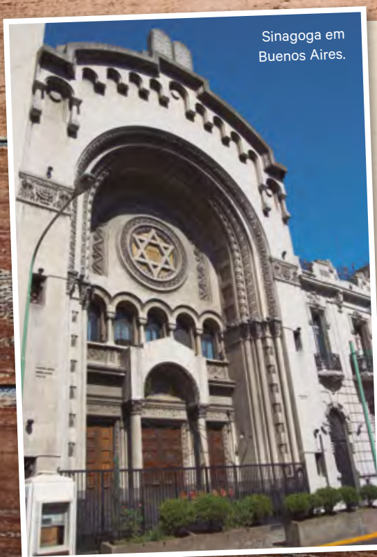
Sinagoga em Buenos Aires.

Hoje, a segunda e terceira geração, filhos e netos dos imigrantes, integram-se à multicultural sociedade israelense, com todos seus matizes.