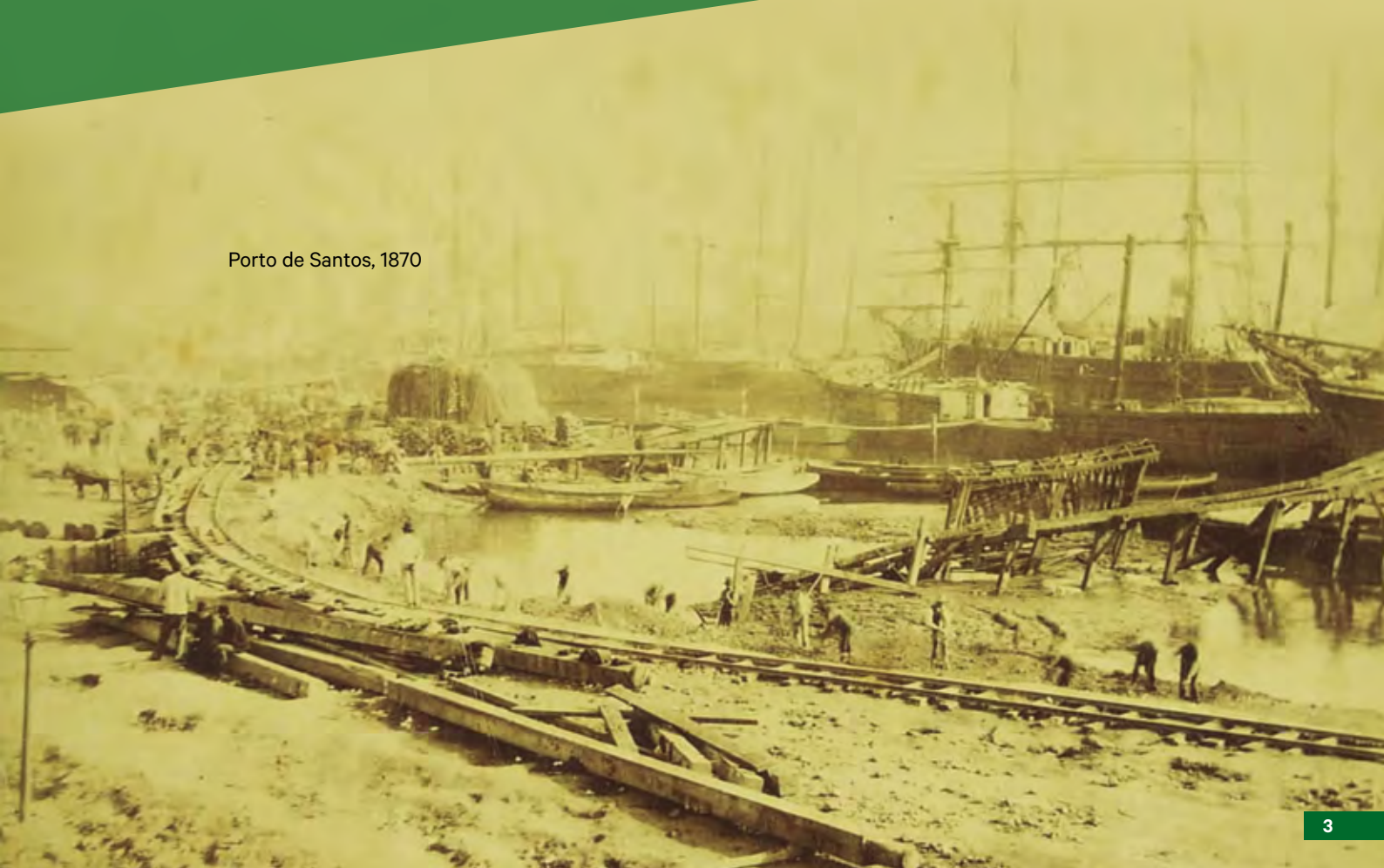
Porto de Santos, 1870

Vieram italianos, japoneses, alemães, libaneses, judeus e mais uma infinidade de povos que encontraram por aqui um lugar agradável para viver. Aqui, listaremos apenas as principais ondas migratórias para o território brasileiro, já que seria impossível contemplar todos os povos que aqui chegaram nesses mais de 500 anos de história.