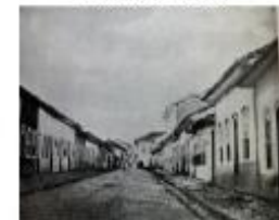
1881 a julho de 1894- Rua da Boa Morte, 39 na sexta casa do lado direito ( o único sobrado nesse lado)