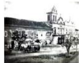
1875- Faculdade de Direito de São Paulo- curso ministrado num Anexo. As meninas ficavam num anexo ao Seminário da Glória, onde atualmente fica o prédio do Correio