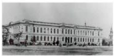
1894- Sede própria da Escola Normal da Praça Ainda com dois Pavimentos

Em 1939, de acordo com o decreto nº10.776, de 12 de dezembro de 1939, o Jardim da infância, o Curso Primário, o curso Ginásial e a Escola Normal de São Paulo receberam o nome de "Escola Caetano de Campos"