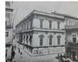
1880-1881-Edifício da antiga Câmara - na Rua do Tesouro