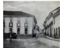
1846- Edifício contíguo à catedral da Sé

Histórico desde a Instalação da Escola Normal em 1846 até a inauguração do prédio da República em 1894