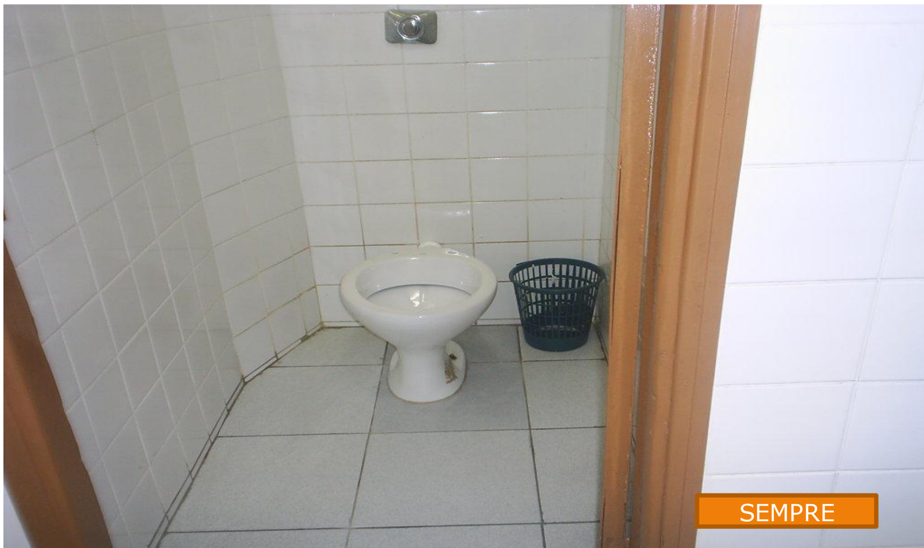
BANHEIRO DO PROFESSORES