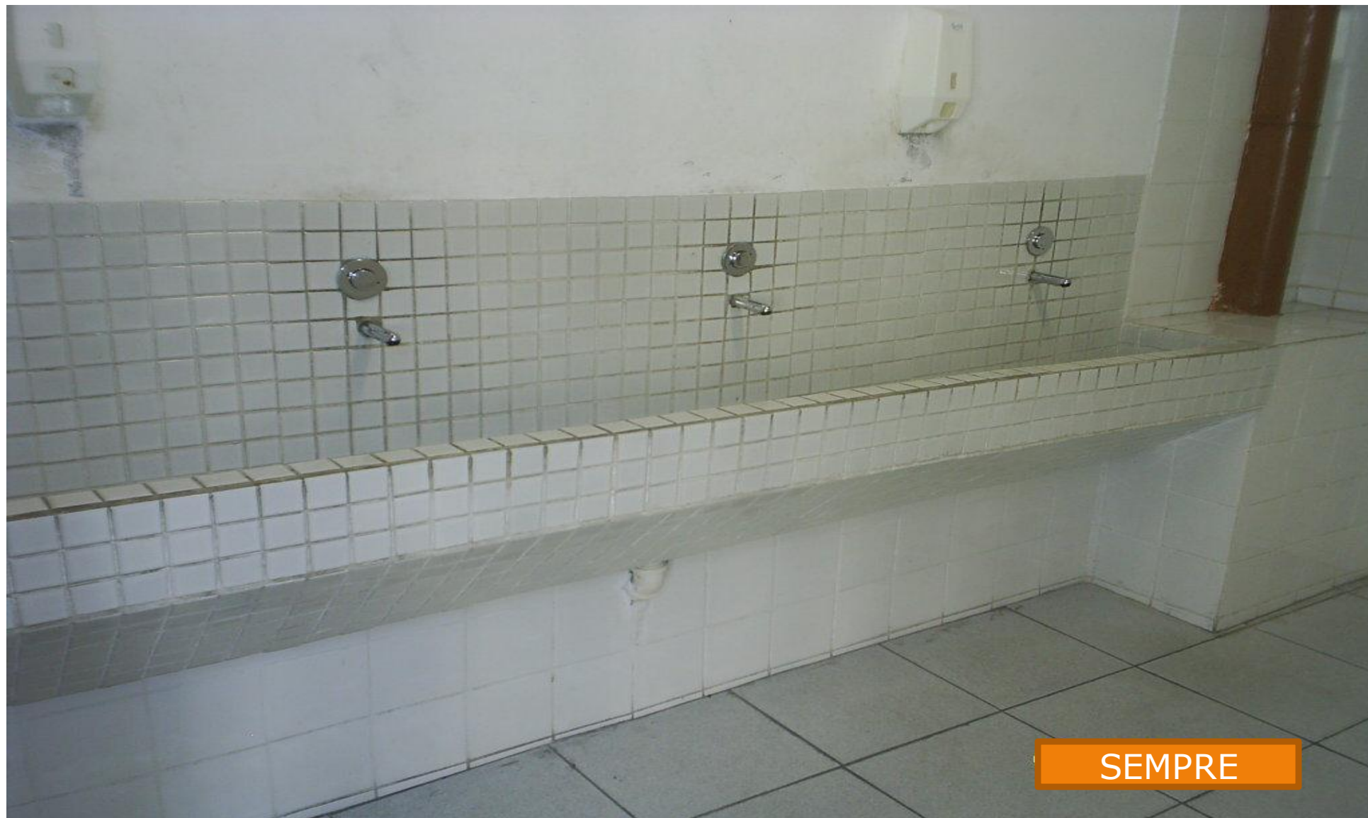
BANHEIRO DOS ALUNOS