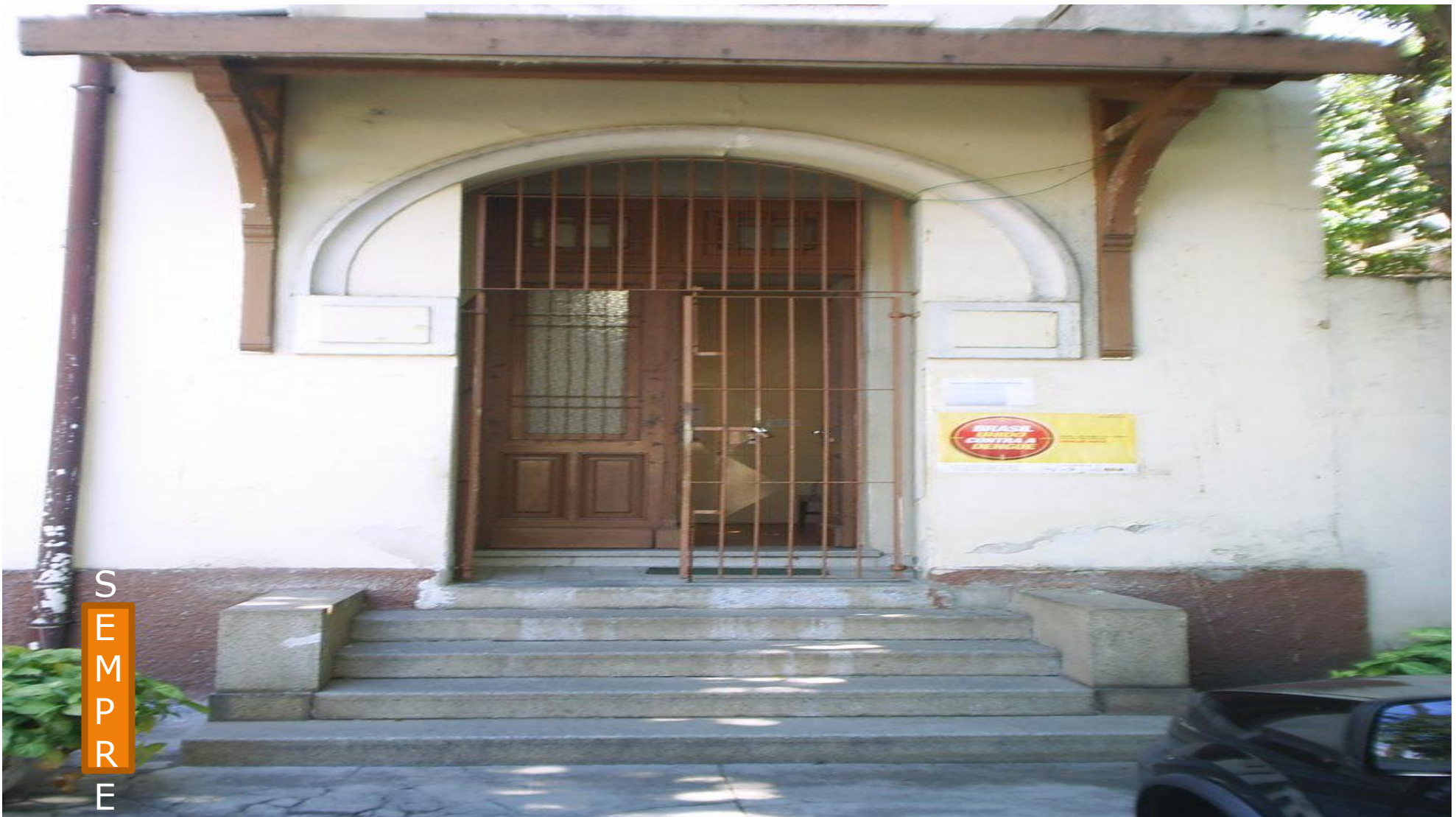
ENTRADA DOS ALUNOS