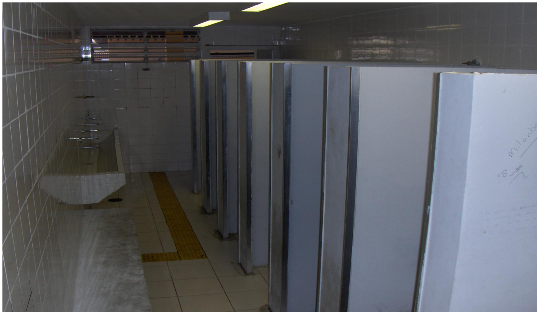
BANHEIRO FEMININO DAS ALUNAS