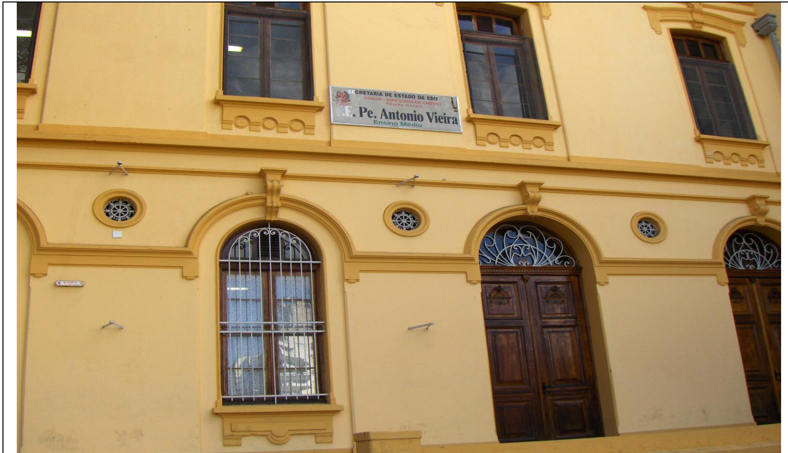
FOTO DA FACHADA