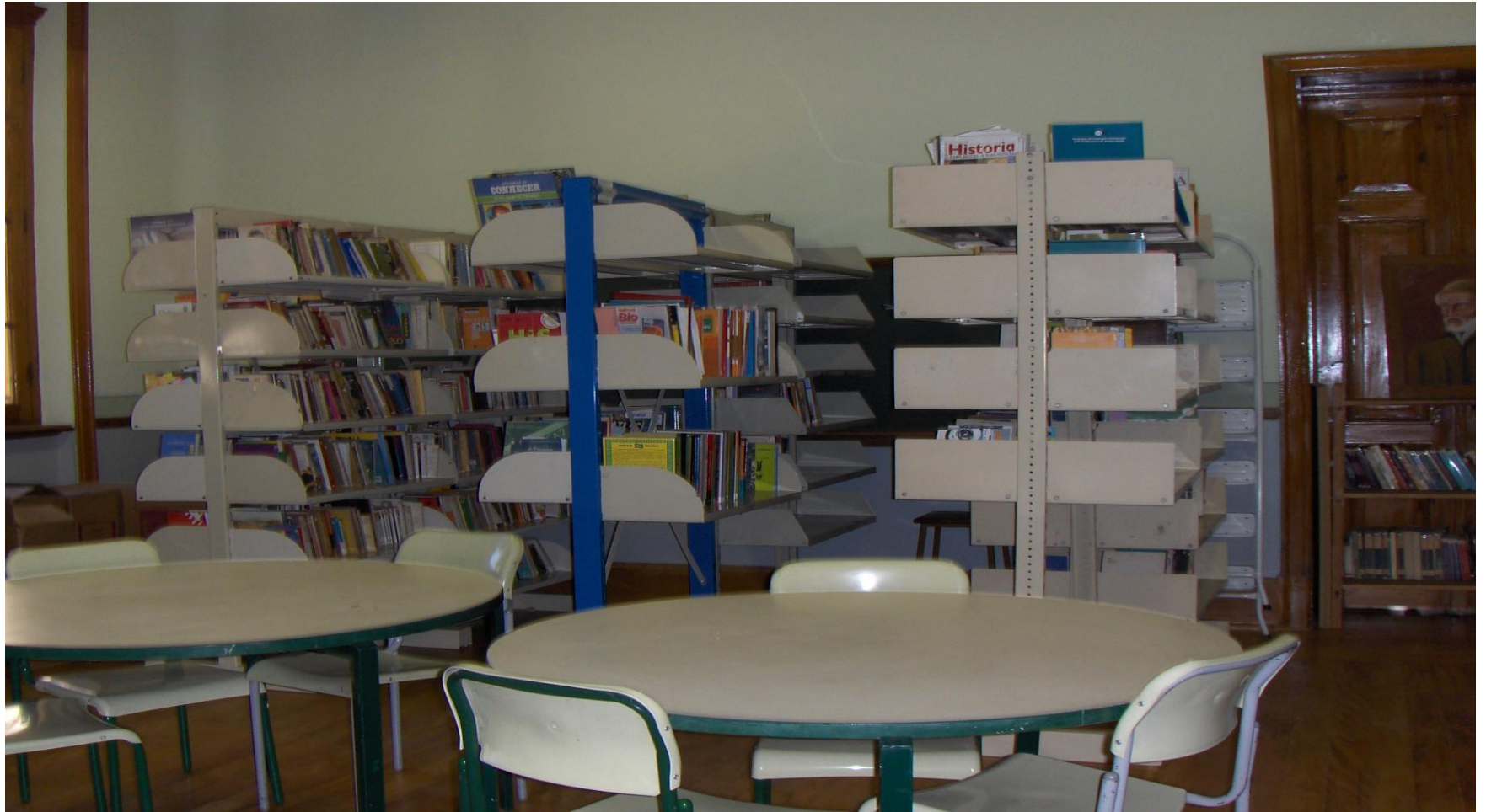
SALA DE LEITURA