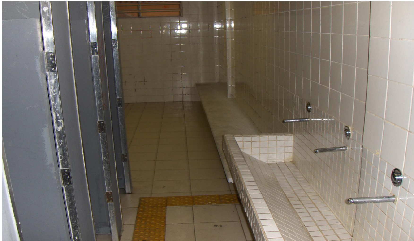
BANHEIRO MASCULINO DOS ALUNOS