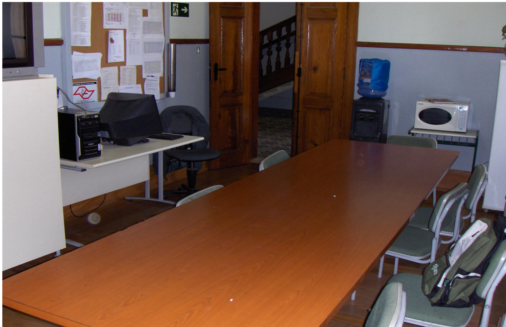
SALA DOS PROFESSORES