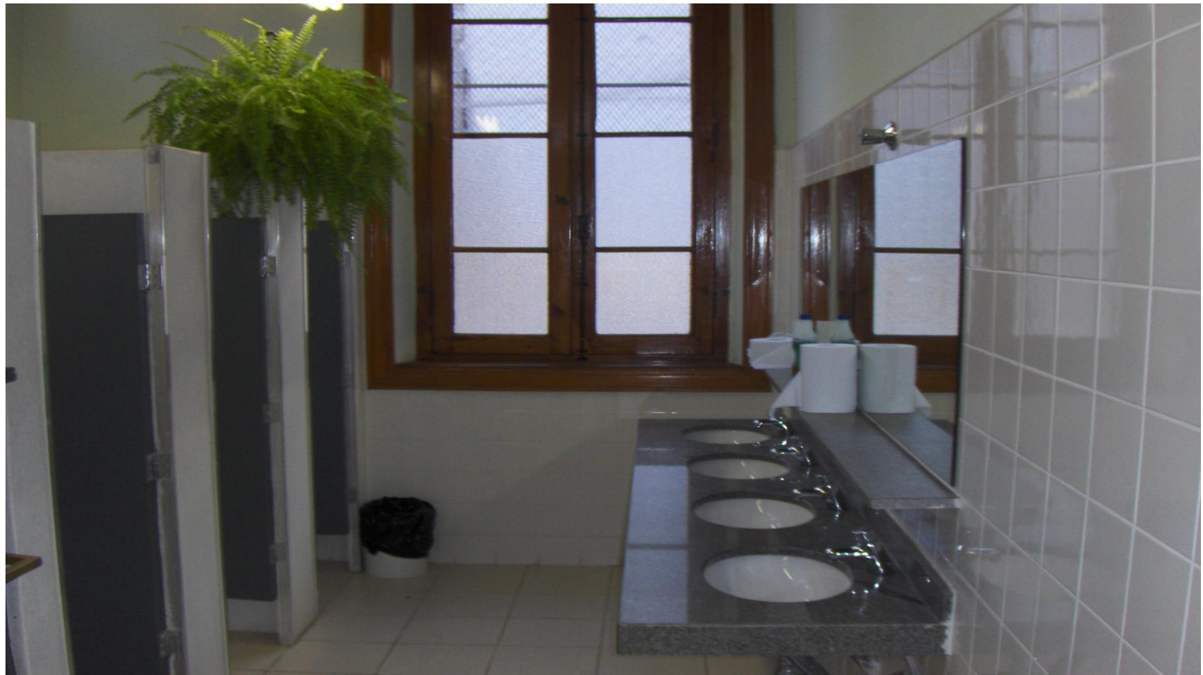
BANHEIRO MASCULINO DOS PROFESSORES