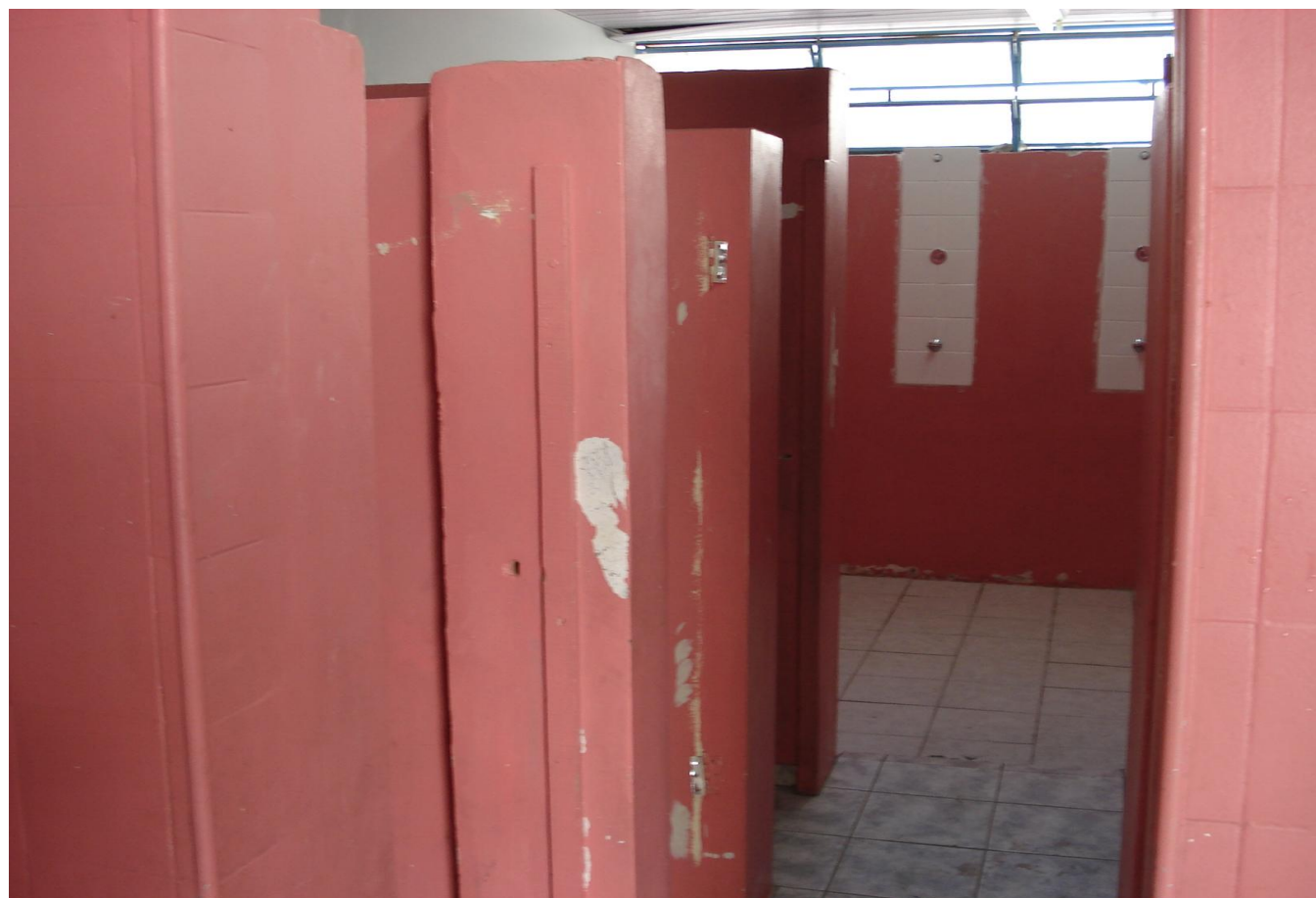
Banheiro das Meninas