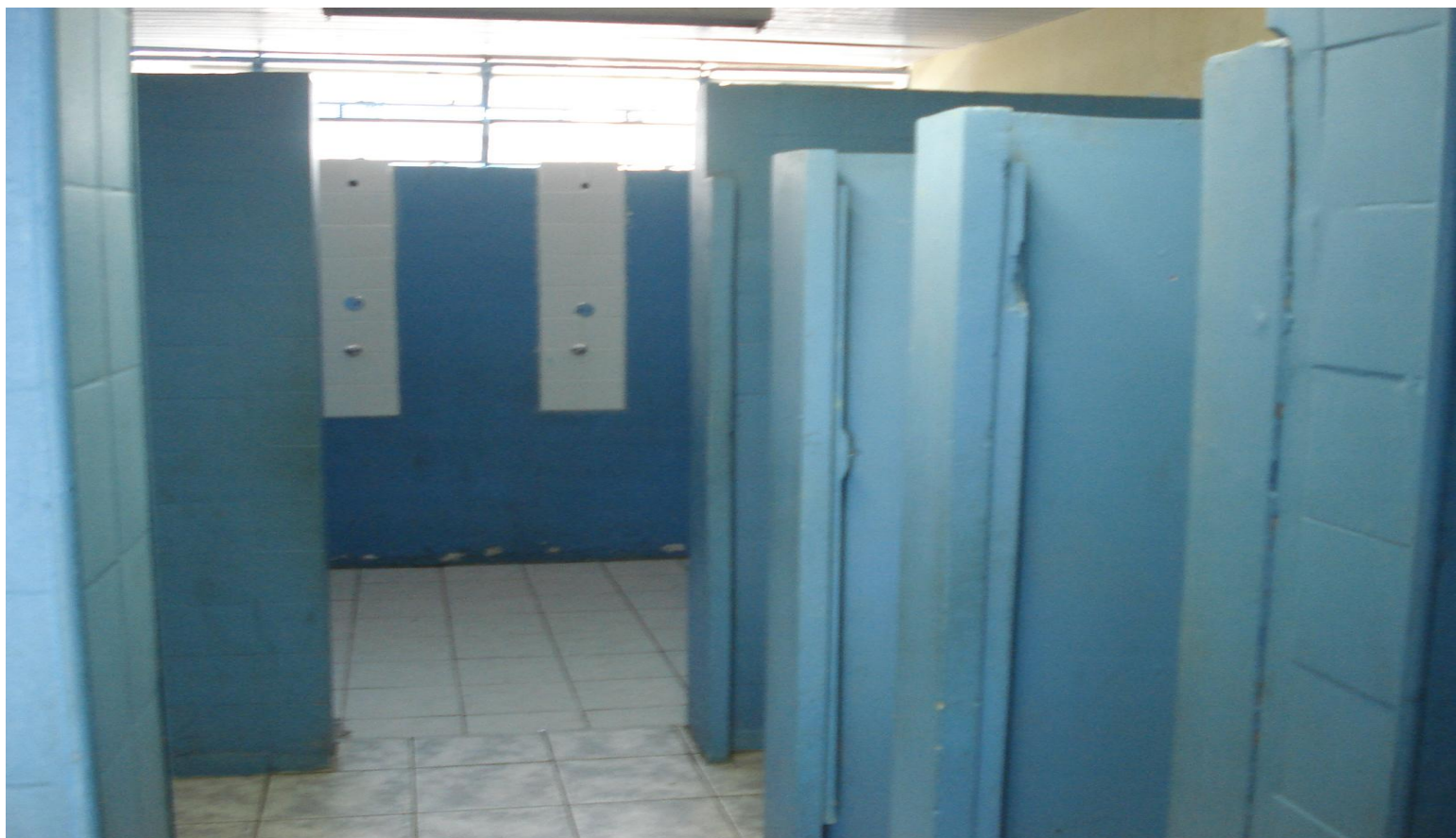
Banheiro dos meninos