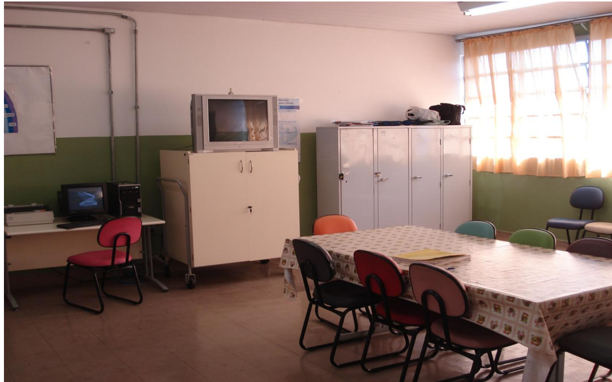
Sala dos professores