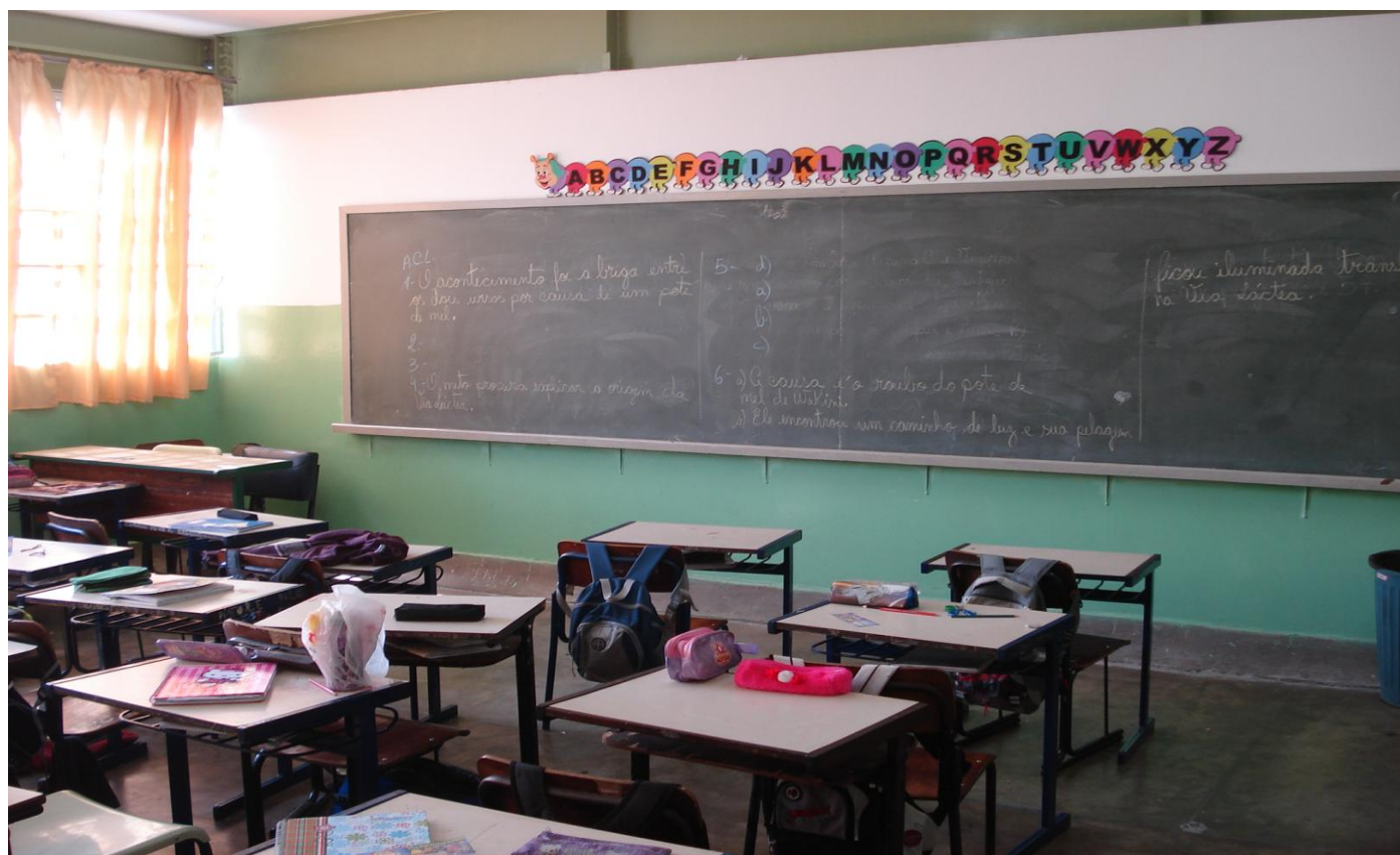
Sala de aula