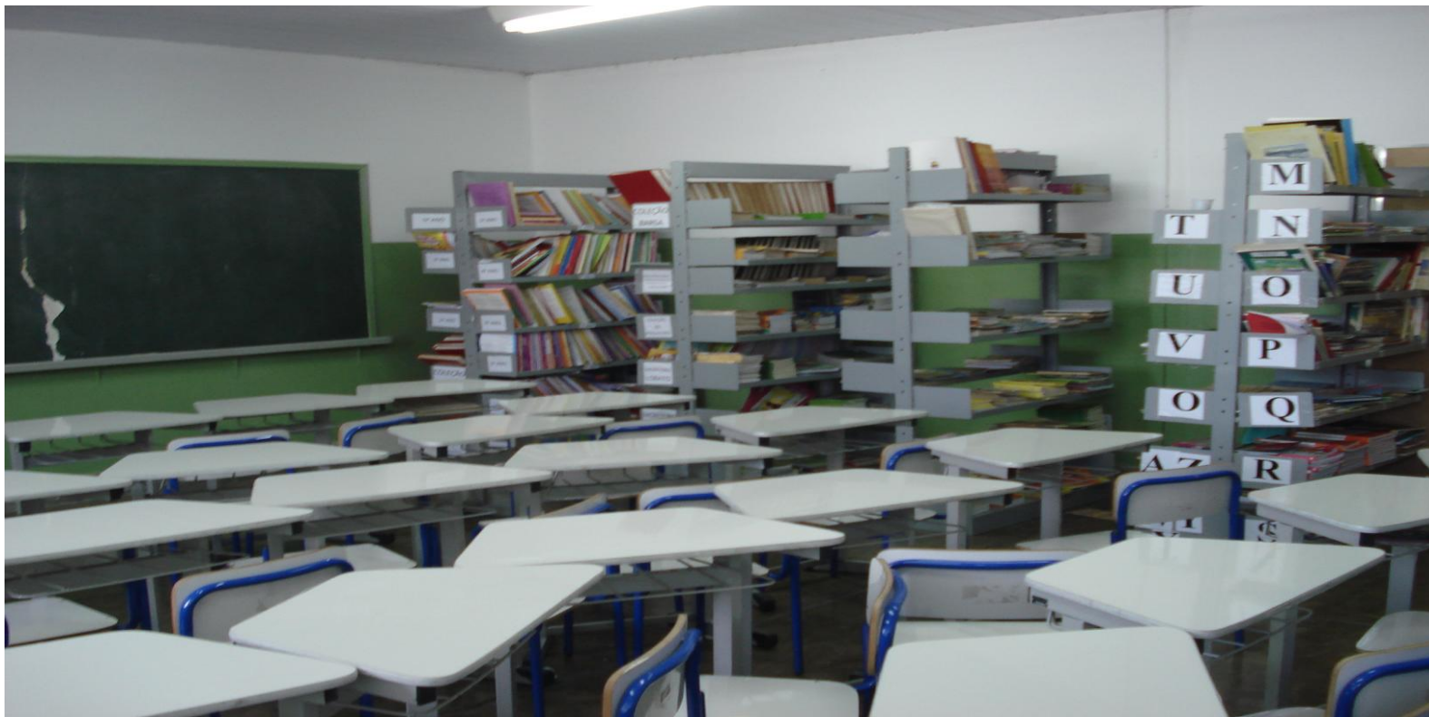
Sala de Leitura