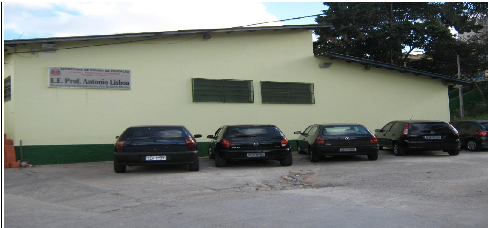
FOTO DA FACHADA

E.E.PROFESSOR ANTONIO LISBOA CIE: 000917 CÓDIGO FDE : 546