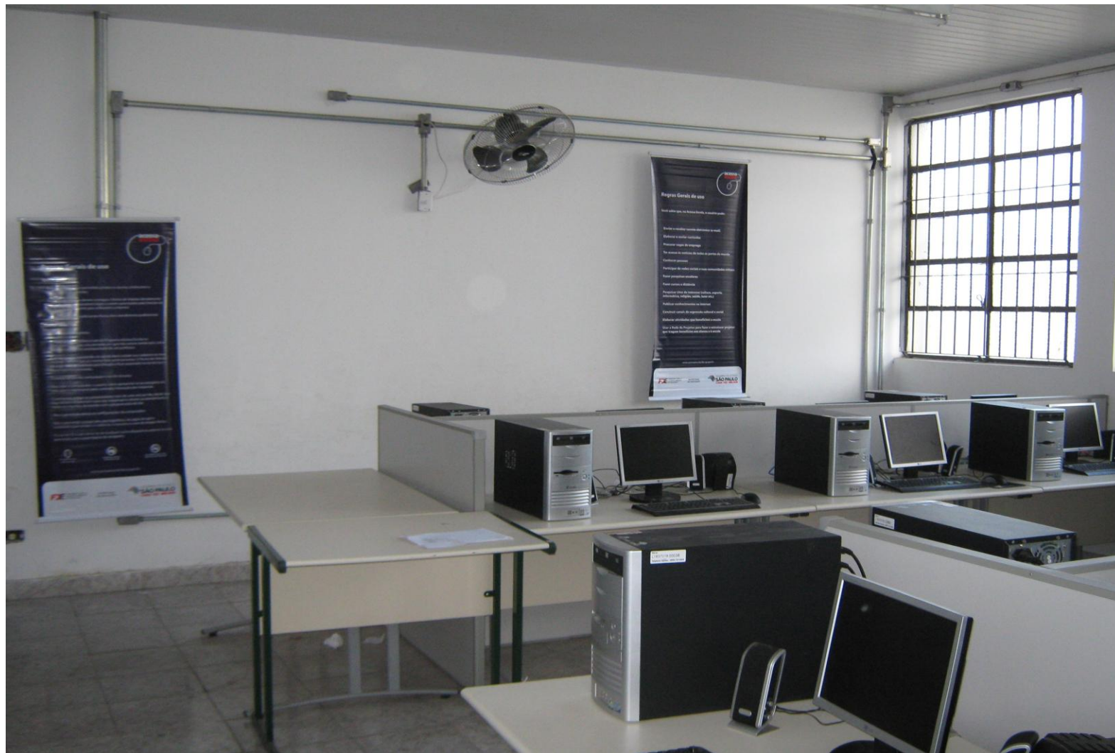
ACESSA ESCOLA / INFORMÁTICA