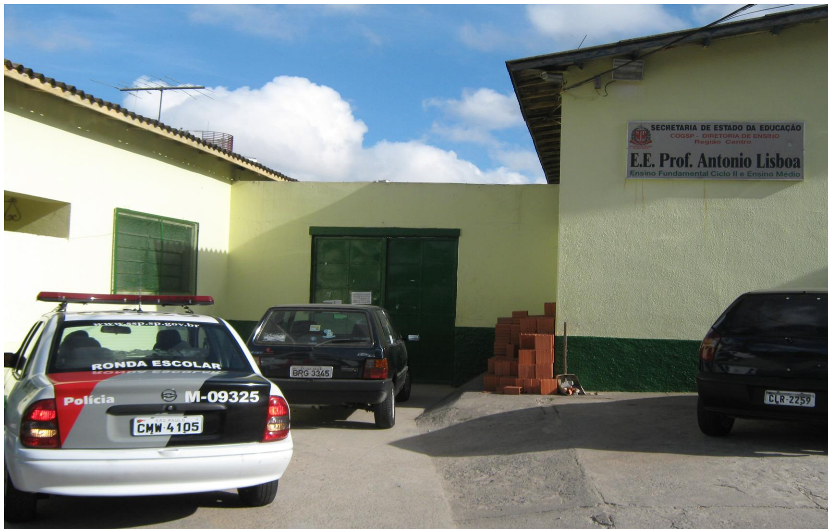
ENTRADA DOS ALUNOS