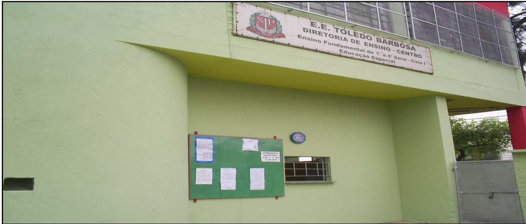
Fachada da Escola