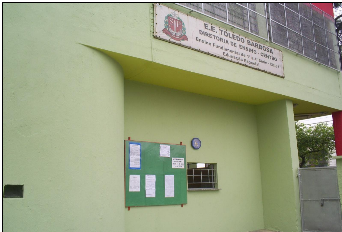
Fachada da Escola