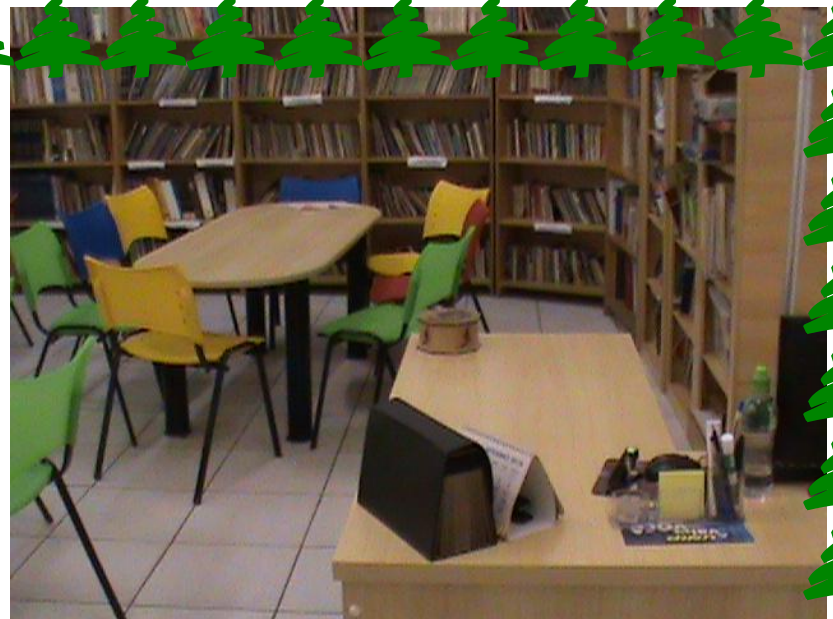
SALA DE LEITURA