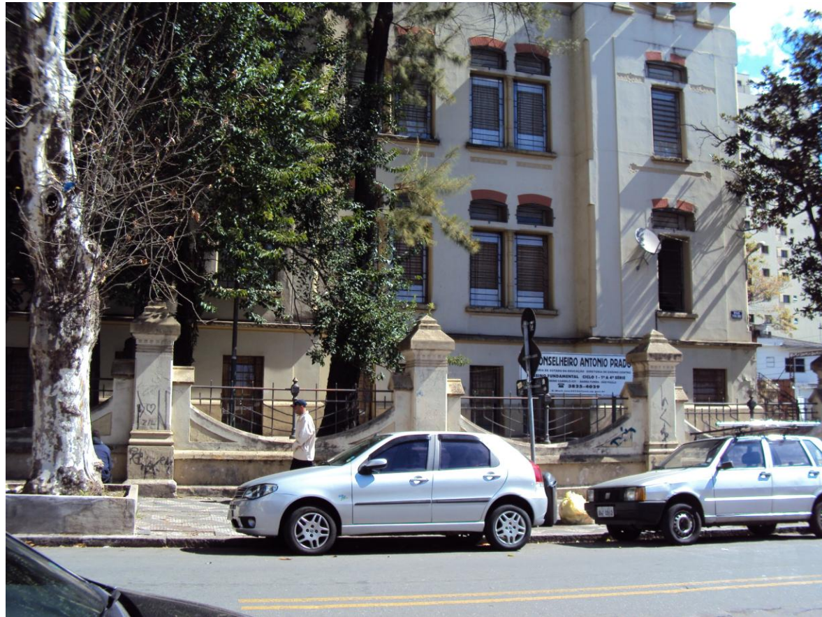
FACHADA DA ESCOLA1