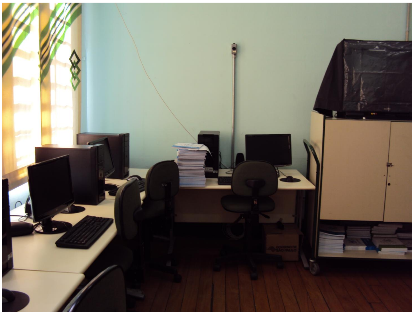
SALA DE INFORMÁTICA COM BIBLIOTECA