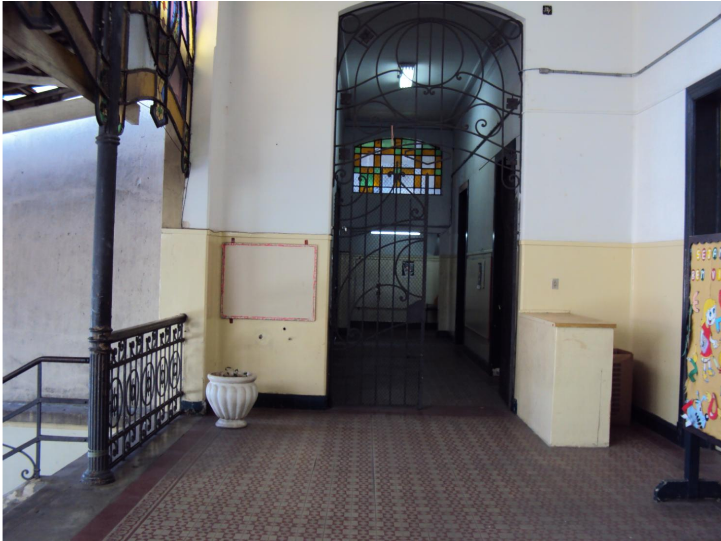
ACESSO AO PÁTIO