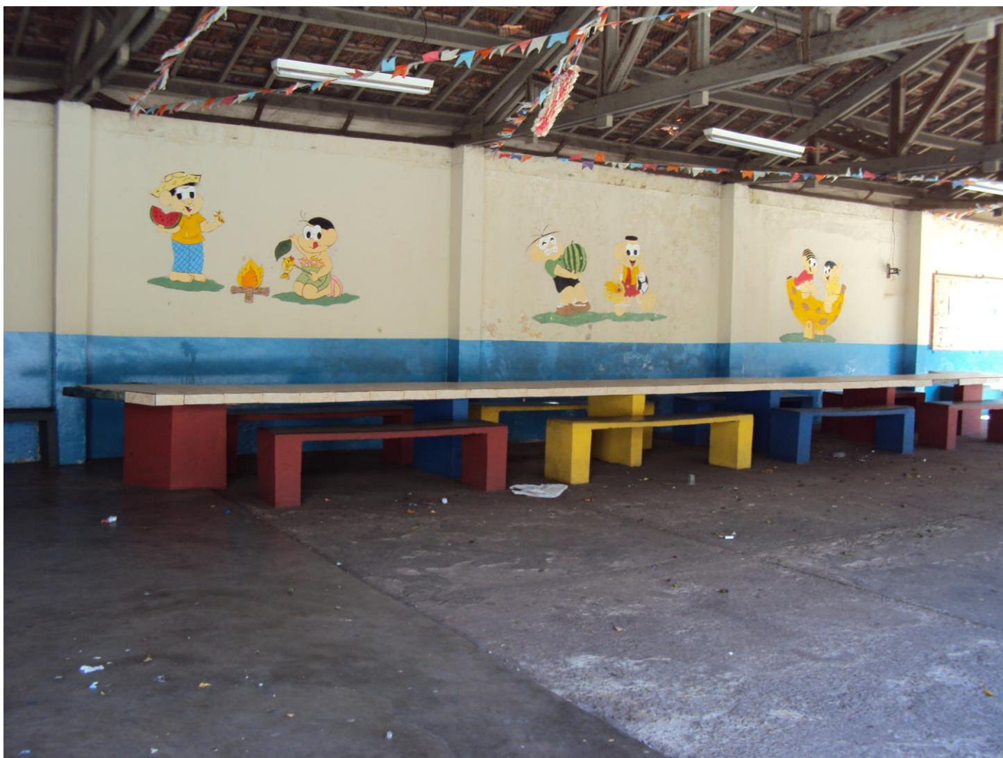
REFEITÓRIO NO PÁTIO