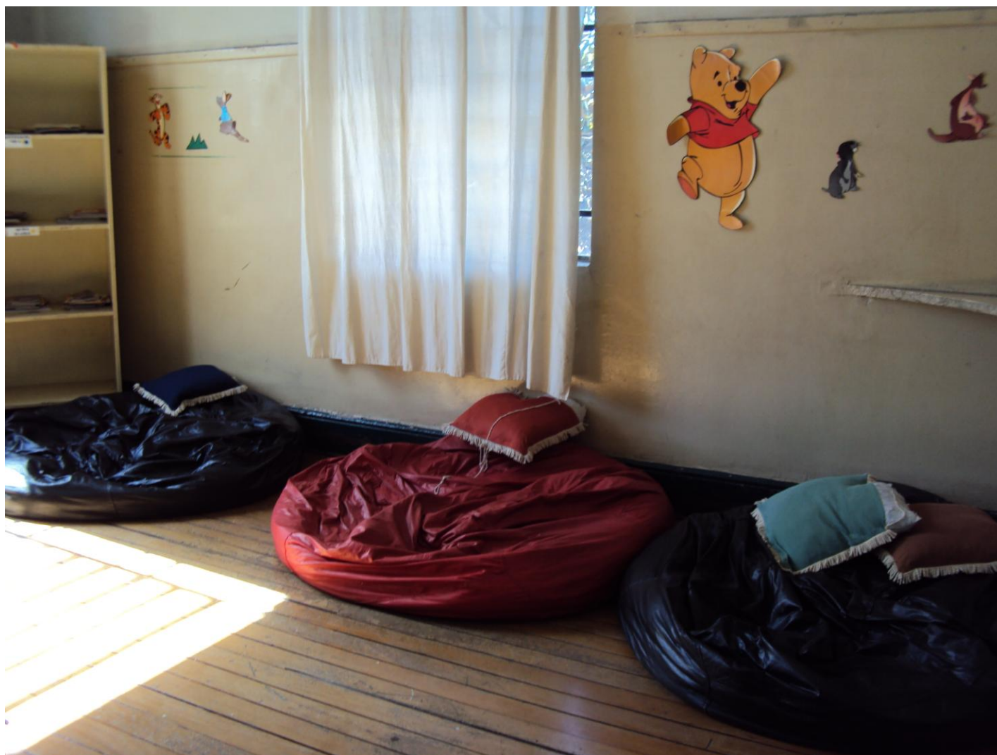
SALA DE LEITURA