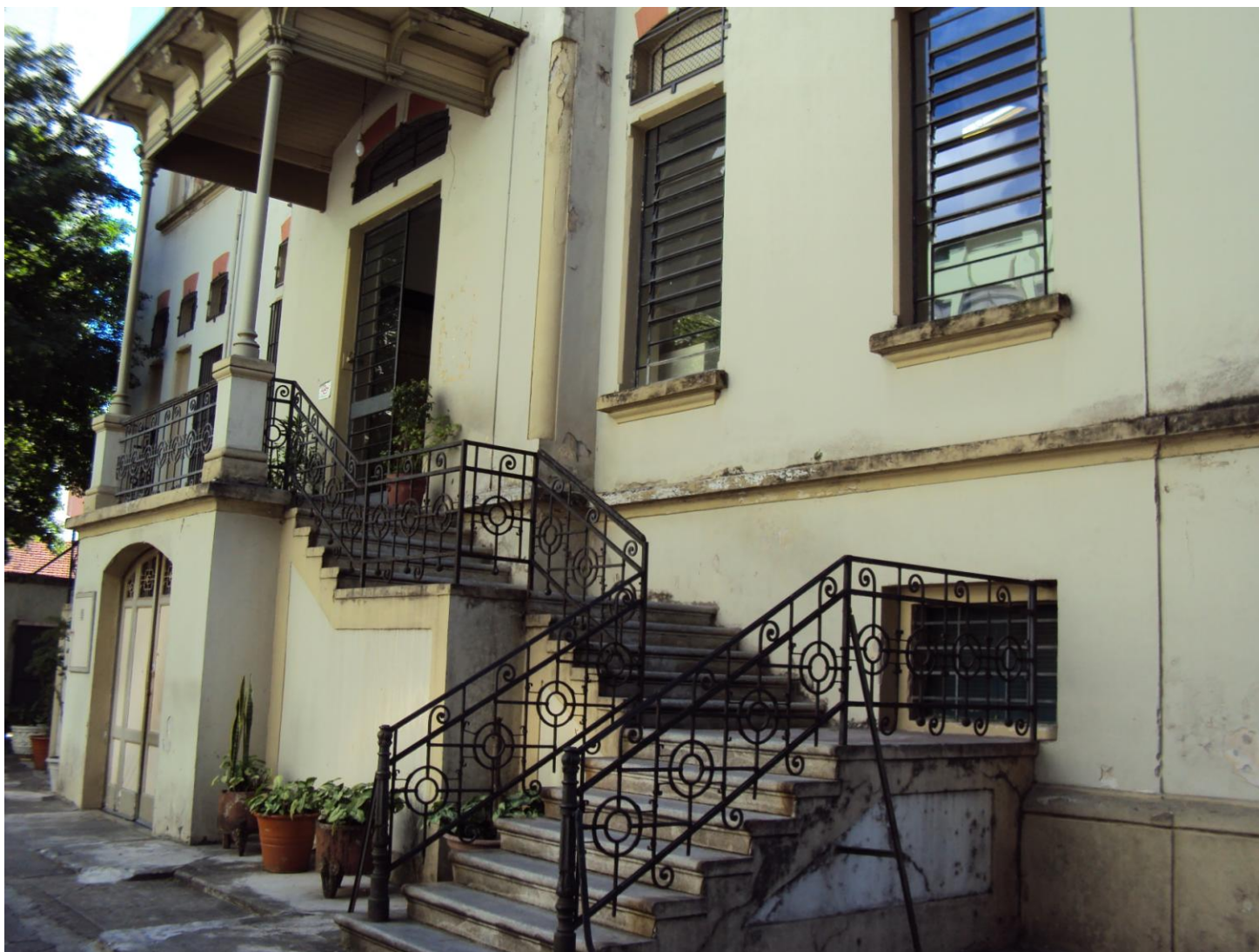
ENTRADA DA ESCOLA